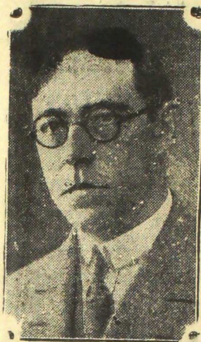
Dr. Nereu Ramos

N. R. — O gesto do sr. Interventor Federal, do Estado, confundindo os derrotistas, e os que nas aratacas da covardia e da traição, combatem o Regime e os homens publicos que os sustentam, vem mostrar a fibra moral e administrativa do dr. Nereu Ramos, que dia a dia mais ainda, se revela, como notavel jurista e inconfundivel chefe de governo.