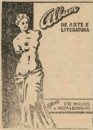
Miniatura da artistica capa do ALBUM DE ARTE E LITERATURA que está sendo distribuida gratuitamente.