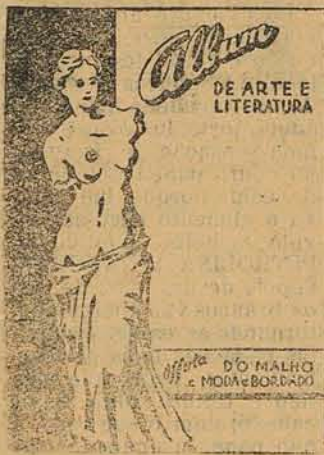
Miniatura da artistica capa do ALBUM DE ARTE E LITERATURA que está sendo distribuida gratuitamente.