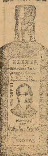
GRANDE DEPURATIVO DO SANGUE