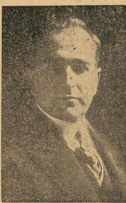
DR. GETULIO VARGAS

mittido percebe-las. Desse isolado e encantador recanto onde a Natureza prodiga reservou um conjunto de harmoniosas e soberbas maravilhas, ouve-se o passaro péceta, em sua canção matinal, cheio de uma caricia divina, tecer de estridulos trinados o hymno de saudação ao pescador, que, ao desponter da alvorada, cantarolando, pallido, com as suas rotas camisas arremangadas rumo ou regressa pelas estradinholas dos areiaes de sua esperança e de sua illusão—a péscia. Um murmuric queixoso ali se observa. E' o avanço incessante e violento das ondas