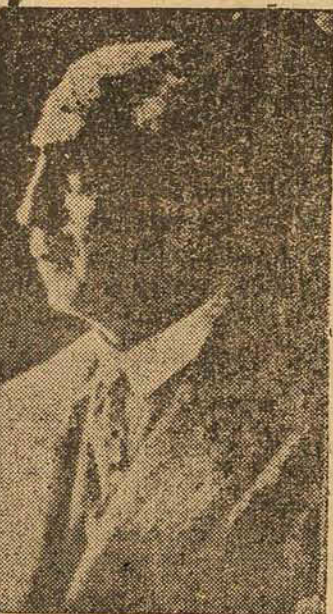
GENERAL PTOLOMEU DE ASSIS BRASIL

Acha-se gravemente enfermo o illustre prelado brasileiro D. Duarte Leopoldo e Silva, arcebispo metropolitano de São Paulo.