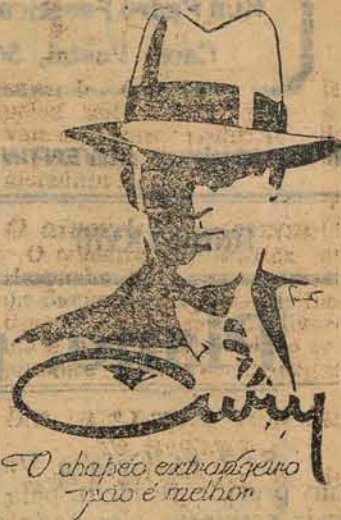
O chapéo extrafino não é melhor

Queira V.S. dar-me a honra de uma visita e, certificando-vos da qualidade dos meus artigos e de seus preços, chegareis á convicção de que para ser bem servido e a preços baratissimos somente na ELITE CATHARINENSE .