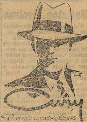
O chapeo entalhado e o melhor