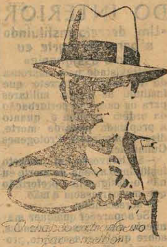
Chapéus extra finos e sapatos em latão

Queira V. S. dar-me a honra de uma visita e, certificando-vos da qualidade dos meus artigos e de seus preços, chegareis á convicção de que para ser bem servido e a preços baratíssimos somente na ELITE CATHARINENSE .