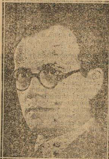
MINISTRO JOSÉ AMÉRICO

Fazemos esta nota observando que ainda mesmo se não houvesse outros motivos para que todos os brasileiros abençoassem a acção do governo provisorio o simples facto de haver a revolução trazido á flôr da corrente os valores que a Republica velha combatia, e procurava menosprezar, é já de si um premio extraordinariamente compensador para todos quanto aspiram uma patria, engrandecida na sua moral e fortalecida nas suas energias civicas e materiaes.