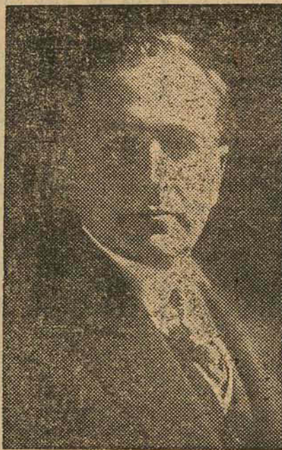
DR. GETULIO VARGAS

sa ephemeride aquelle municipio consagrou o referido dia data maxima da revolução, porque é aquella que melhor interpreta o regosijo da população que viu satisfeitas as suas patrióticas aspirações.