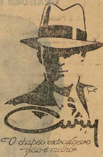
O chapeo extraordinario pois é melhor

Queira V.S. dar-me a honra de uma visita e, certificando-vos da qualidade dos meus artigos e de seus preços, chegareis á convicção de que para ser bem servido e a preços baratissimos somente na ELITE CATHARINENSE .