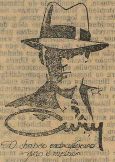
O chapéu extrafino é o melhor

Queira V.S. dar-me a honra de uma visita e, certificando-vos da qualidade dos meus artigos e de seus preços, chegareis á convicção de que para ser bem servido e a preços baratíssimos somente na ELITE CATHARINENSE .