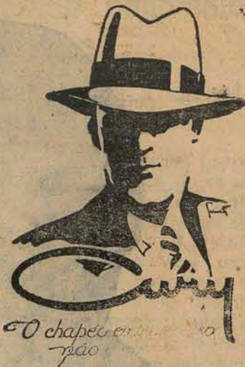
O chapéo em moda

Queira V.S. dar-me a honra de uma visita e, certificando-vos da qualidade dos meus artigos e de seus preços, chegareis á convicção de que para ser bem servido e a preços baratissimos somente na ELITE CATHARINENSE .