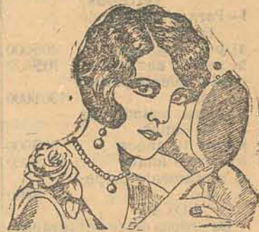
30 ANOS DE SUCESSO

O mais extraordinario romance da actualidade DEPOIS, de E. M. Remarque, o autor de «Nada de novo na frente occidental». Vende-se nesta redacção.