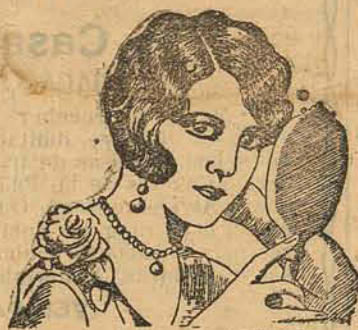
30 ANOS DE SUCESSO

O mais extraordinario romance da actualidade DEPOIS, de E. M. Remarque, o autor de «Nada de novo na frente occidental». Vende-se nesta redacção.