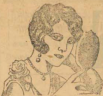
30 ANOS DE SUCESSO

Faz-se, por isso, um appello a todos que tiveram a felicidade de reunir algumas economias para que se lembrem de que podem augmentar-as rapidamente depositando-as, com retiradas sob aviso, na solida instituição social que é a Constructora Catharinense .