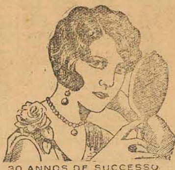
30 ANOS DE SUCESSO

Faz-se, por isso, um apello a todos que tiveram a felicidade de reunir algumas economias para que se lembrem de que podem augmental-as rapidamente depositando-as, com retiradas sob aviso, na solida instituição social que é a Constructora Catharinense .