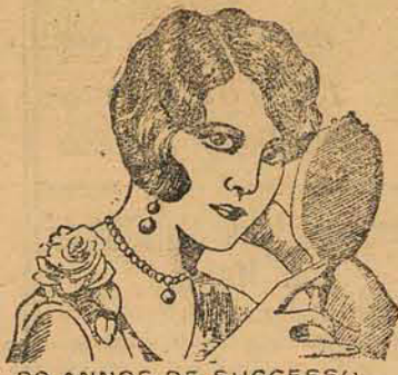
30 ANOS DE SUCESSO

Faz-se, por isso, um appello a todos que tiveram a felicidade de reunir algumas economias para que se lembrem de que podem augmental-as rapidamente depositando-as, com retiradas sob aviso, na solida instituição social que é a Constructora Catharinense .