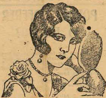
30 ANOS DE SUCESSO

Faz-se, por isso, um appello a todos que tiveram a felicidade de reunir algumas economias para que se lembrem de que podem augmental-as rapidamente depositando-as, com retiradas sob aviso, na solida instituição social que é a Constructora Catharinense