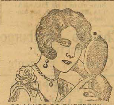
30 ANOS DE SUCESSO

Faz-se, por isso, um appello a todos que tiveram a felicidade de reunir algumas economias para que se lembrem de que podem augmental-as rapidamente depositando-as, com retiradas sob aviso, na solida instituição social que é a Constructora Catharinense .