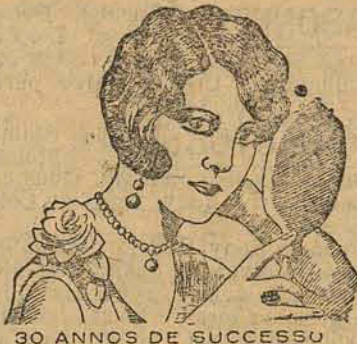
30 ANOS DE SUCESSO

Pilulas Ferma (BOETTGER) Fortifica o fraco e vermelha o pallido. PROCURE NA PHARMACIA Cruz Coutinho