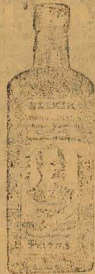
GRANDE DEPURATIVO DO SANGUE

Manipulação feita com capricho e rigorosa hygiene Attende-se a qualquer hora da noite.