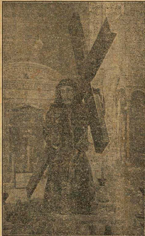
Imagem de N. S. dos Passos, venerada na Matriz desta cidade

Todas as solennidades foram acompanhadas com o maior fervor, obedecendo a uma ordem verdadeiramente exemplar. Nem a chuva impenitente nem a agglomeração de povo lograram desviar, por um momento sequer, o imenso prestito, da ordem estabelecida.