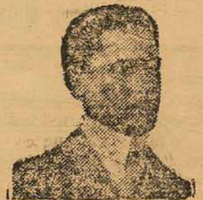
Srs. Viuva Silveira & Filho