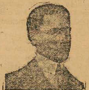
Srs. Viuva Silveira & Filho

Soffri por muitos annos de Rheu- matismos, atacando-me ultimamen- te de forma assustadora, ao ponto de recolher-me ao hospital, onde per- maneci um mez em rigoroso trata- mento, sem resultado positivo. Achando-me nesta emergencia, re- corri ao poderoso depurativo "ELI- XIR DE NOGUEIRA", do Phar- maceutico Chimico João da Silva Silveira, restabelecendo-me comple- tamente de tão atroz soffrimento.