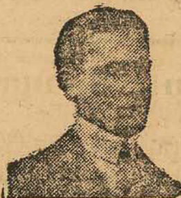
Srs. Viuva Silveira & Filho