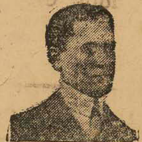
Srs. Viuva Silveira & Filho