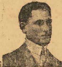
Srs. Viuva Silveira & Filho