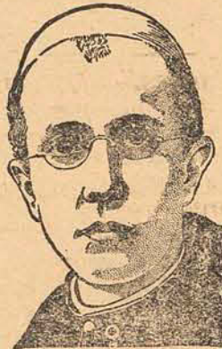
DR. DOM RICARDO CASASOVA Y ESTRADA Arcebispo de Guatemala