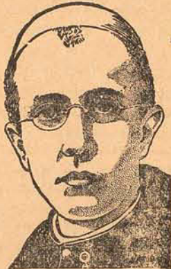
DR. DOM RICARDO CASANOVA Y ESTRADA Arcebispo de Guatemala