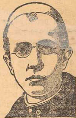
DR. DOM RICARDO CASANOVA Y ESTRADA Arcebispo de Guatemala