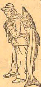
Sem esta marca nenhuma é legitima

NÃO CONTEM ALCOHOL, GUAIACOL, CREOSOTA NEM NENHUMA SUBSTANCIA NOCIVA OU IRRITANTE.