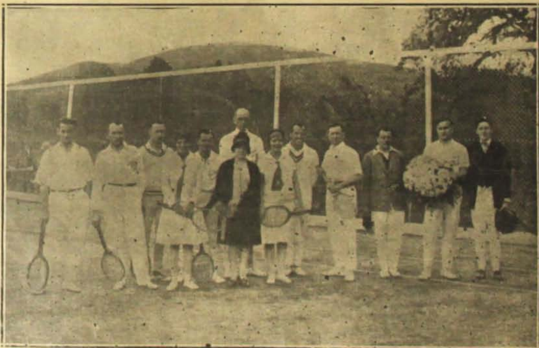
Outro grupo de socios e convidados, que encontram na cultura do "tennis" a mais salutar distração para as horas de ocio.

Temos em mão o ultimo balanço do anno financeiro, que se encerrou em 30 de Setembro p. p. E' um do-