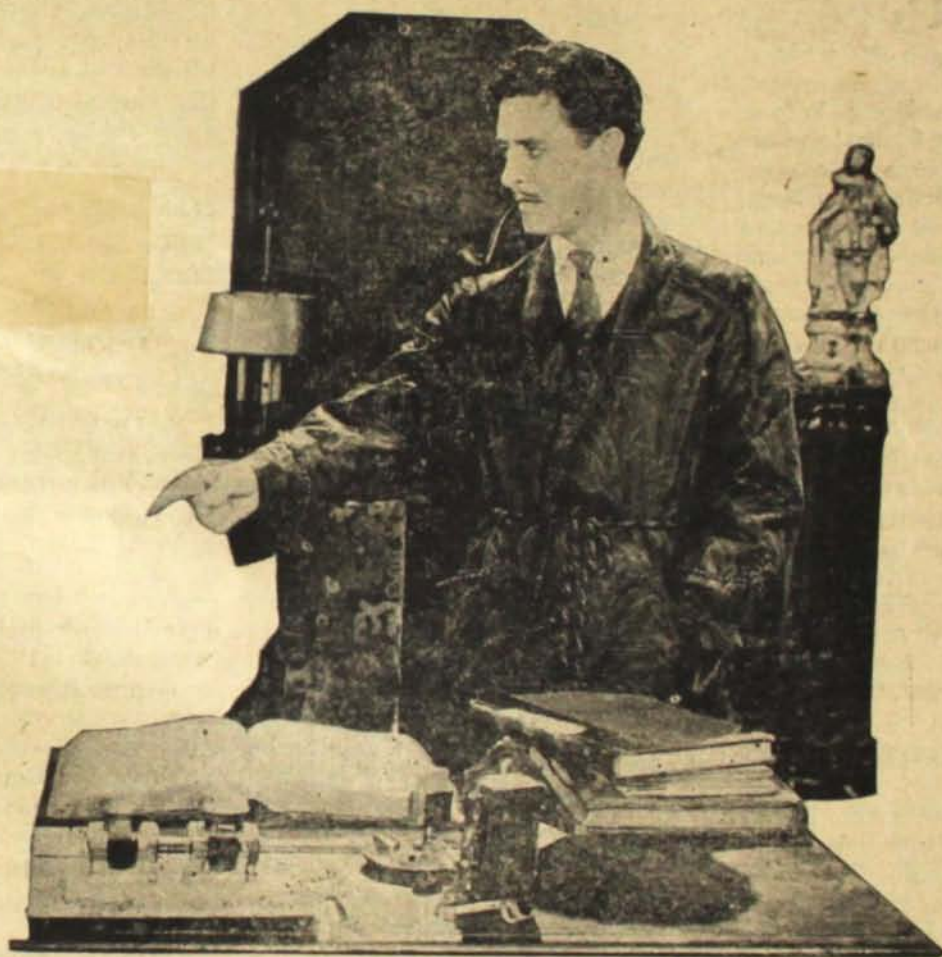
John Gilbert tem o segredo de fascinar as mulheres bonitas...