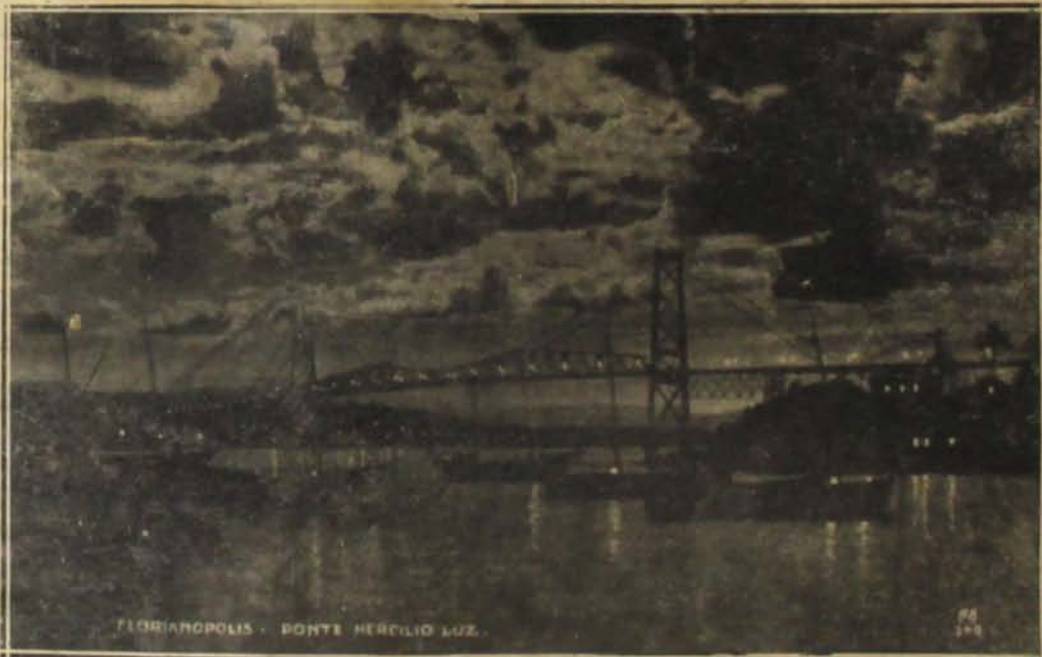
FLORIANOPOLIS — O lindo aspectó da "Ponte Hercilio Luz" ao anoitecer

decahidas e ninho de ra- tazanas. A pi- cureta da mo- dernisação ali trabalhou e as obras para a construcção do viaducto e Avenida Bor- ges de Medel- ros, marcham em franco pro- grésso. A con- strucção desse viaducto vem resolver uma velha aspira- ção popular: ligar a cidade baixa ao cen- tro. Tambem a abertura da hoje Avenida São Raphael e da Avenida