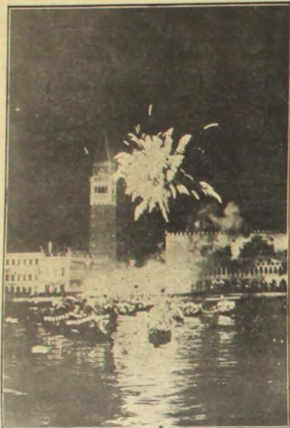
Veneza, a cidade aquatica, numa noite de festa

Diz um despacho de Veneza, que publicamos neste número, que a parte baixa da cidade, inclusive a histórica praça de São Marcos, está inundada, em consequência da elevação da maré.