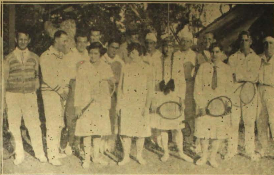
Um grupo de valerosos socios do "Lyra Tennis Club" que dão ás lindas tardes desportivas, organisadas pela Directoria, um cubo de alta elegancia e animação.

Augmento do numero de socios, a Directoria acaba de providenciar um grande melhoramento na séde social, que constará de uma varanda envidraçada, em estylo de jardim de inverno , com duas frentes: a primeira para o lado da bahia sul, com um comprimento de 18.50 metros; e a segunda para o lado da cidade, com 12 metros de extensão. A largura desse novo alpendre envidraçado será de 5 metros.