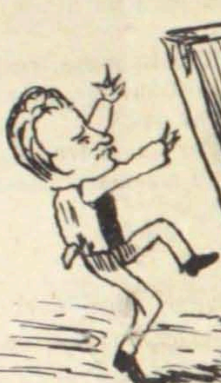
Elle! sempre elle!