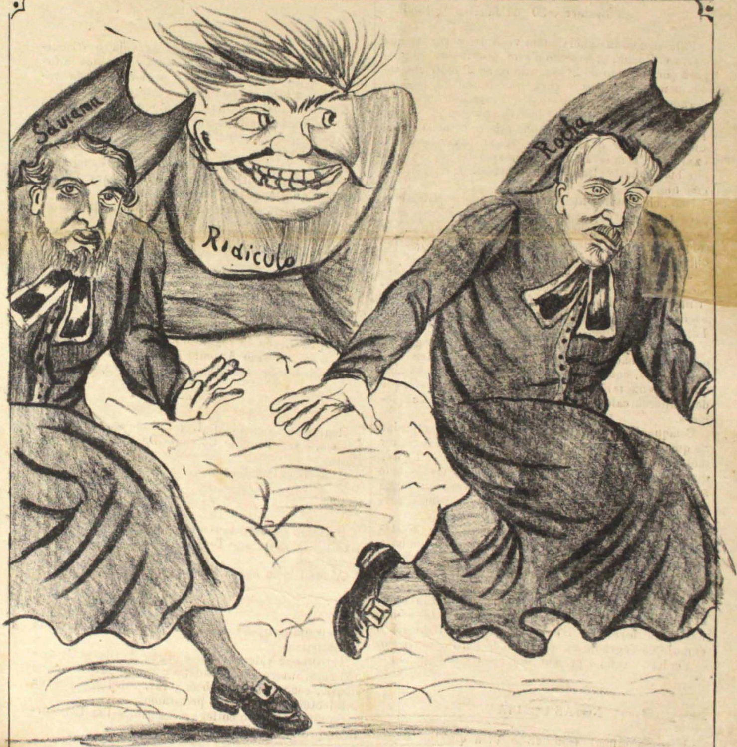
Para tão beatas e encyclopedicas figuras só este monstro terrivel.