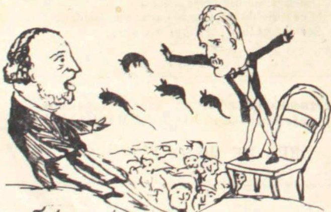
Trégoas! trégoas! grita o infeliz torturado, perseguido ainda pelo espectro!