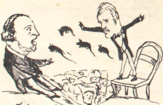
Tréguas! tréguas! grita o infeliz torturado, perseguido ainda pelo espectro!