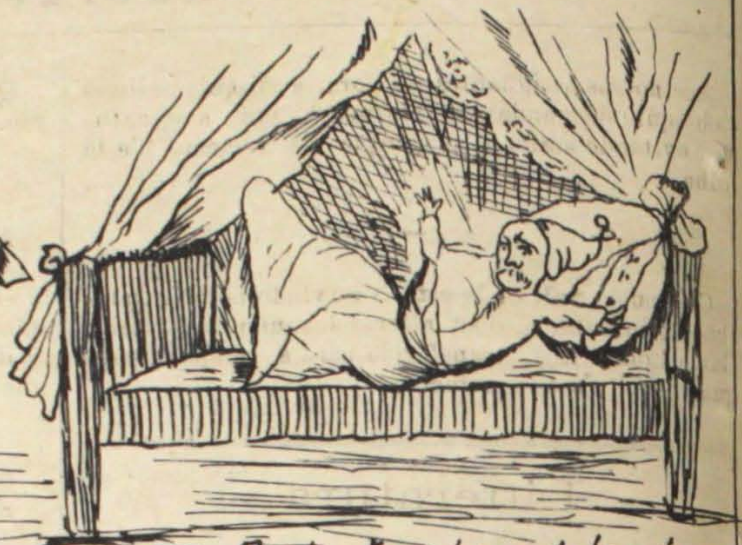
O sr. Rocha tem pezadelos por causa da dissidencia..