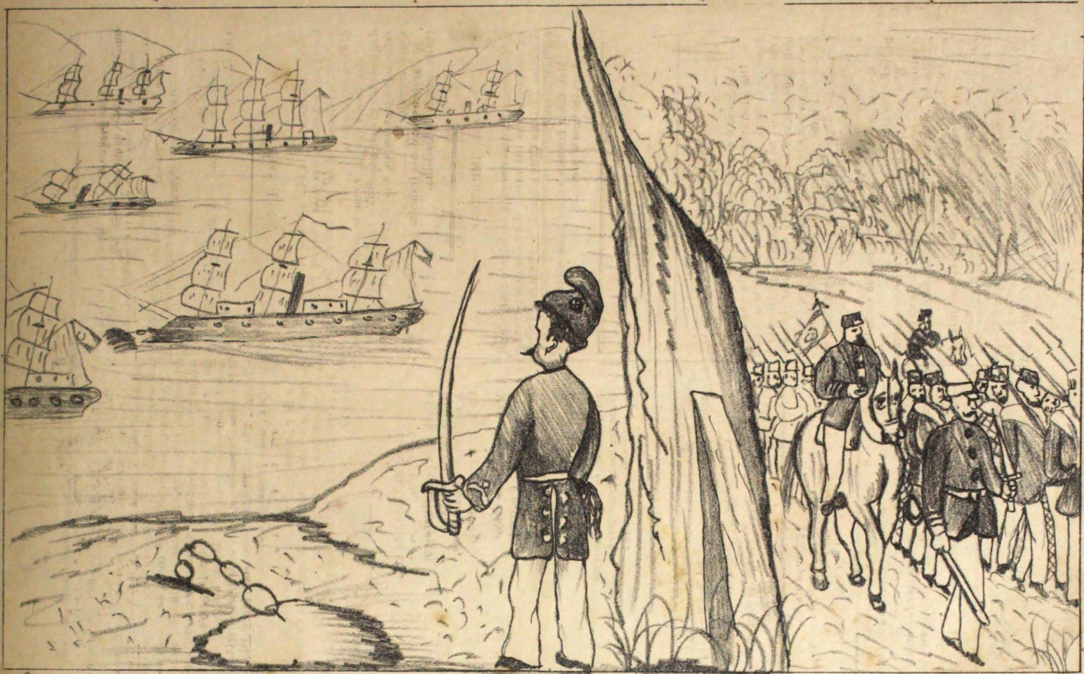
O governo Imperial, receiando os effeitos cauizados pela "Voz do Povo" do Coutinho, resolveo mandar a quartelar n'esta cidade o Satalhão 17; e consta-nos que vem estacionar em nosso porto uma esquadriha de seis dos nossos melhores navios da nossa armada. E viva o novo ditador em prespectiva!