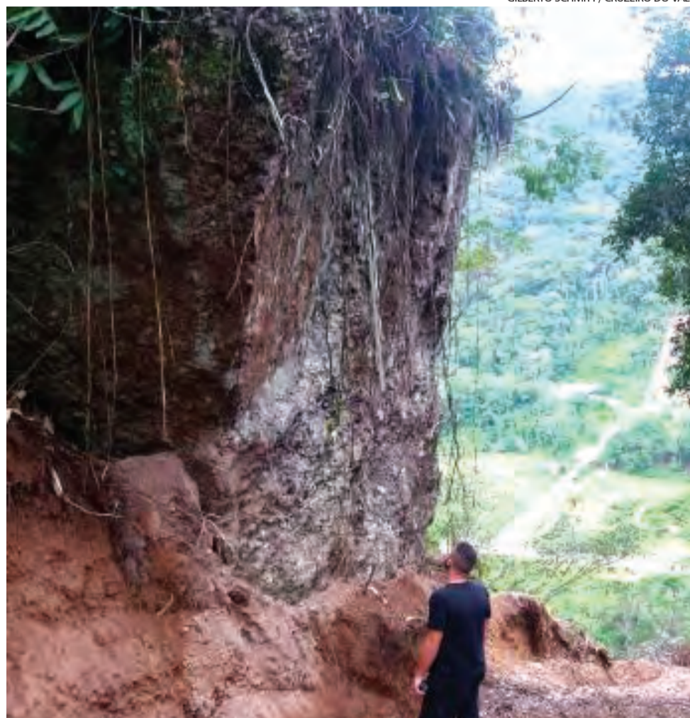
BASE de sustentação das pedras foi danificada e famílias impedidas de ficar em casa

A rua aberta foi ligada a uma antiga, já existente no local. A parte nova corresponde a uma extensão de cerca de um quilômetro mata à dentro. Durante sua construção, a máquina passou ao lado de pedras enormes existentes no local há anos. A base que dava sustentação às pedras foi comprometida e, agora, elas ameaçam rolar.