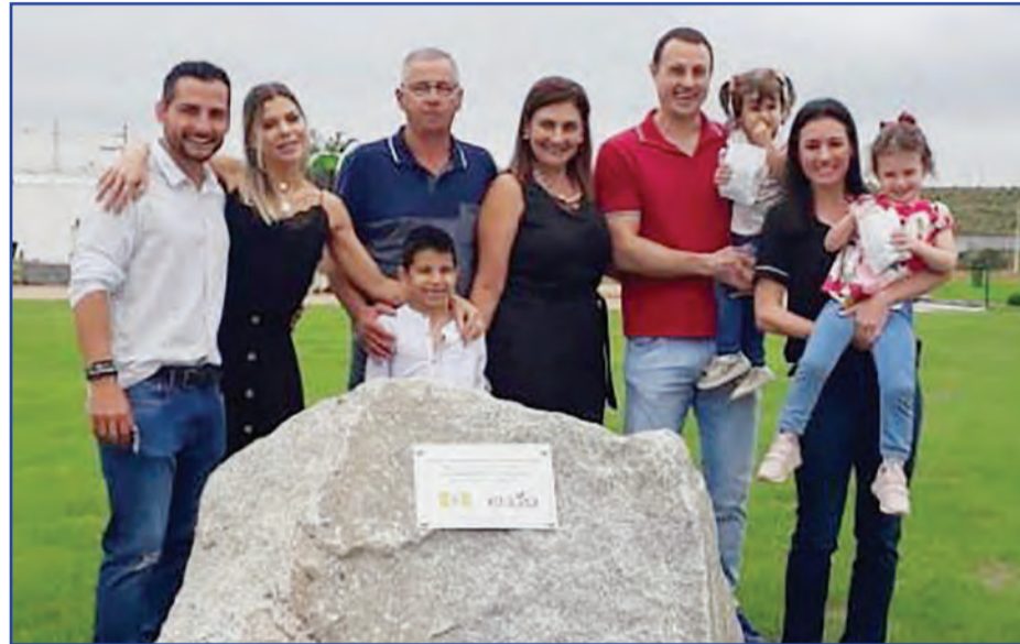
Família Chiesa comemora unida o sucesso e a entrega do Loteamento Itália 3

Um ano e dois meses antes do prazo, Edifika Empreendimentos Imobiliários entregou loteamento aos compradores