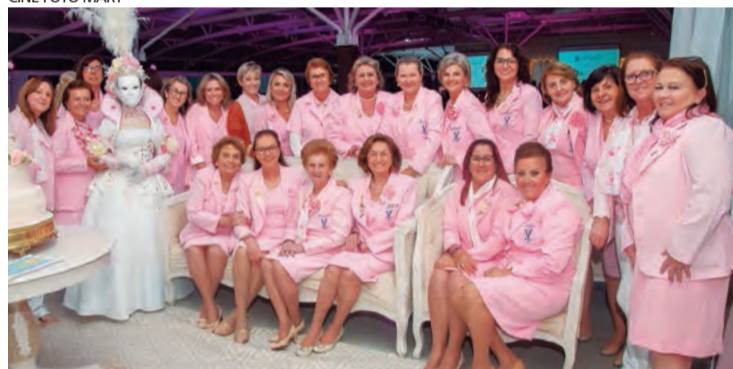
CINE FOTO MARY