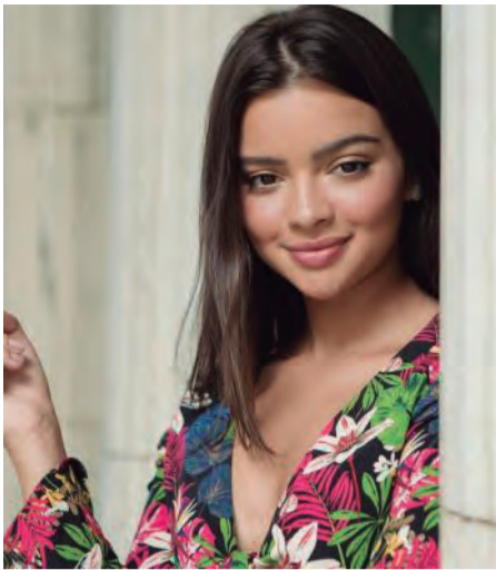
NANDA em Malhação