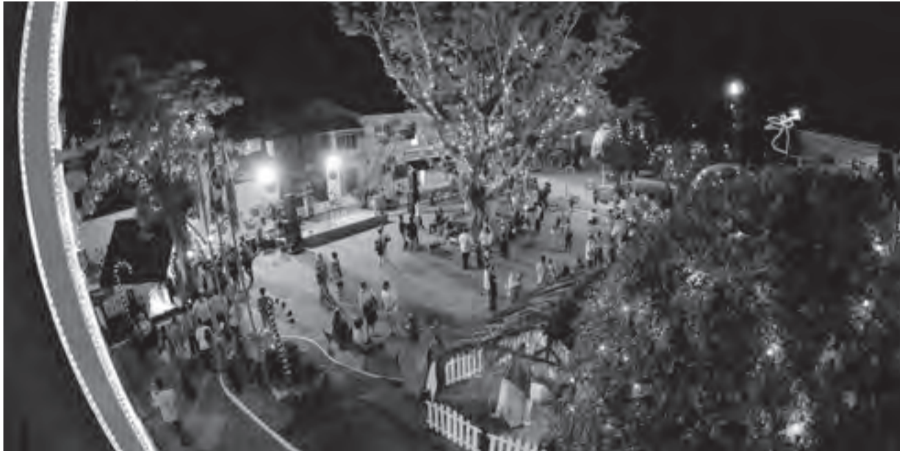
PRAÇA de Natal, no Centro de Gaspar, conta com decoração que inclui presépio e Casa do Papai Noel

momento foi conferido de perto por centenas de pessoas, que tomaram conta das calçadas da principal rua da cidade.