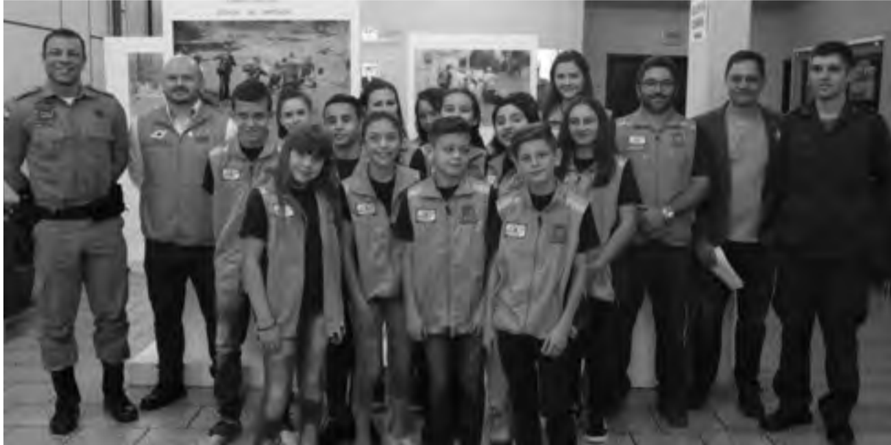
DEVIDAMENTE uniformizadas, crianças concluíram curso e agora são Agentes Mirins da Defesa Civil de Gaspar

Uma experiência positiva e cheia de aprendizagens. Na quinta-feira, dia 6 de dezembro, aconteceu a formatura da primeira turma do projeto 'Agente Mirim', desenvolvido pela Defesa Civil de Gaspar. O evento, marcado pela entrega de certificados, carteira de identificação e medalhas aos estudantes aconteceu no plenário da Câmara de Vereadores na presença de familiares dos alunos, professores, autoridades e profissionais que aplicaram os conteúdos desenvolvidos.