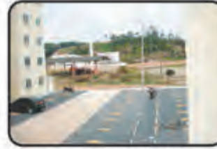
REF. 866 - Apto. 02 dormitórios, BWC, cozinha, sacada, 01 vaga de garagem, área de serviço, churrasqueira e elevador. Com 60m 2 . Bairro: Gaspar Grande. R$ 145.000,00