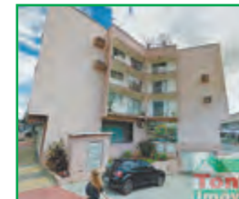
Ref. 1030 – Apartamento no bairro Centro, com 113m², 03 quartos, banheiro, sala, cozinha, área de serviço, sacada, 01 vaga de garagem. Valor: R$290.000,00