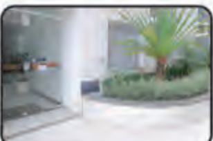
836 - Bela Vista - 1 Suite, 1 Dormitório, Sala, Cozinha, BWC, 1 vaga de Garagem, Elevador. Apto c/ 75m 2 - R$ 195.000,00