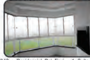
842 - Residencial Del Fiori - 1 Suite, 1 Dormitório, Com vista para a cidade, 2 Vagas na Garagem. Bairro Margem Esquerda. Apto C/ 95,60m 2 . - R$ 335.000,00