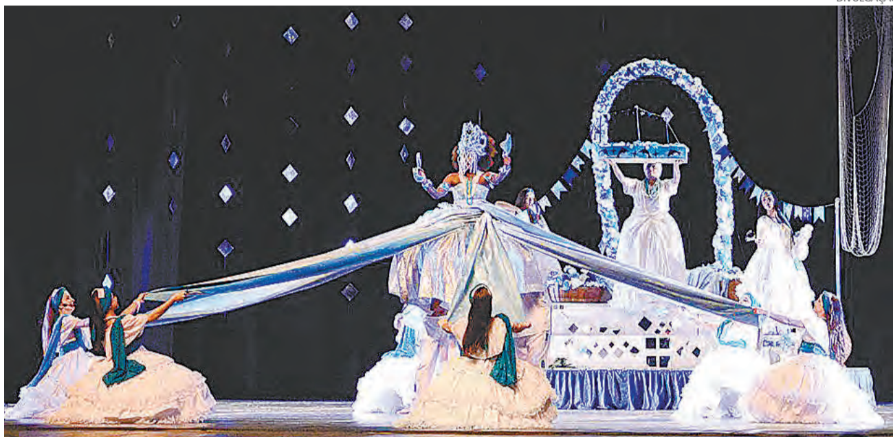
APRESENTAÇÕES que foram ouro e bronze no Festival de Dança de Joinville serão mostradas ao público

Aos que prestigiarem as belíssimas apresentações e dese-