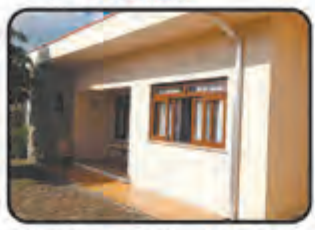
REF. 850 1 Suite, 2 Dormitórios, Sala de visitas e de TV, Varanda, Cozinha, Despensa, 2 Vagas de garagem. Figueira R$ 345 MIL