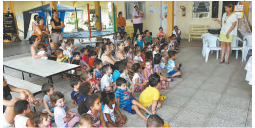
CDI Thereza Bedusch, no bairro Barracão, completa 20 anos

fim de animar toda a comunidade presente, terão apresentações das crianças e ainda será possível participar da pescaria, sacola surpresa e sorteio da rifa, que acontecerá às 19h.