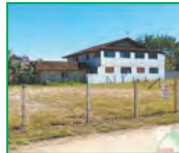
Ref. 1108 – Terreno no bairro Sete de Setembro com 414m². Valor: R$190.000,00