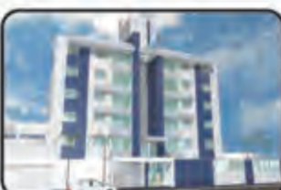
757 - 07 de setembro - 1 Suite, 2 Dormitórios, 2 Vagas de Garagem, Salão de Festas, Piscina, Elevador. Apto c/ 122,46 M 2 . INC.: 23.882 - à consultar