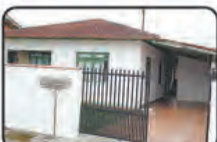
REF. 841 - 3 Dormitórios, 1 BWC, Sala de Visitas, Varanda, Cozinha, Garagem, Churrasqueira. Bairro 07 de Setembro. Casa C/ 90 m 2 . R$ 235.000,00