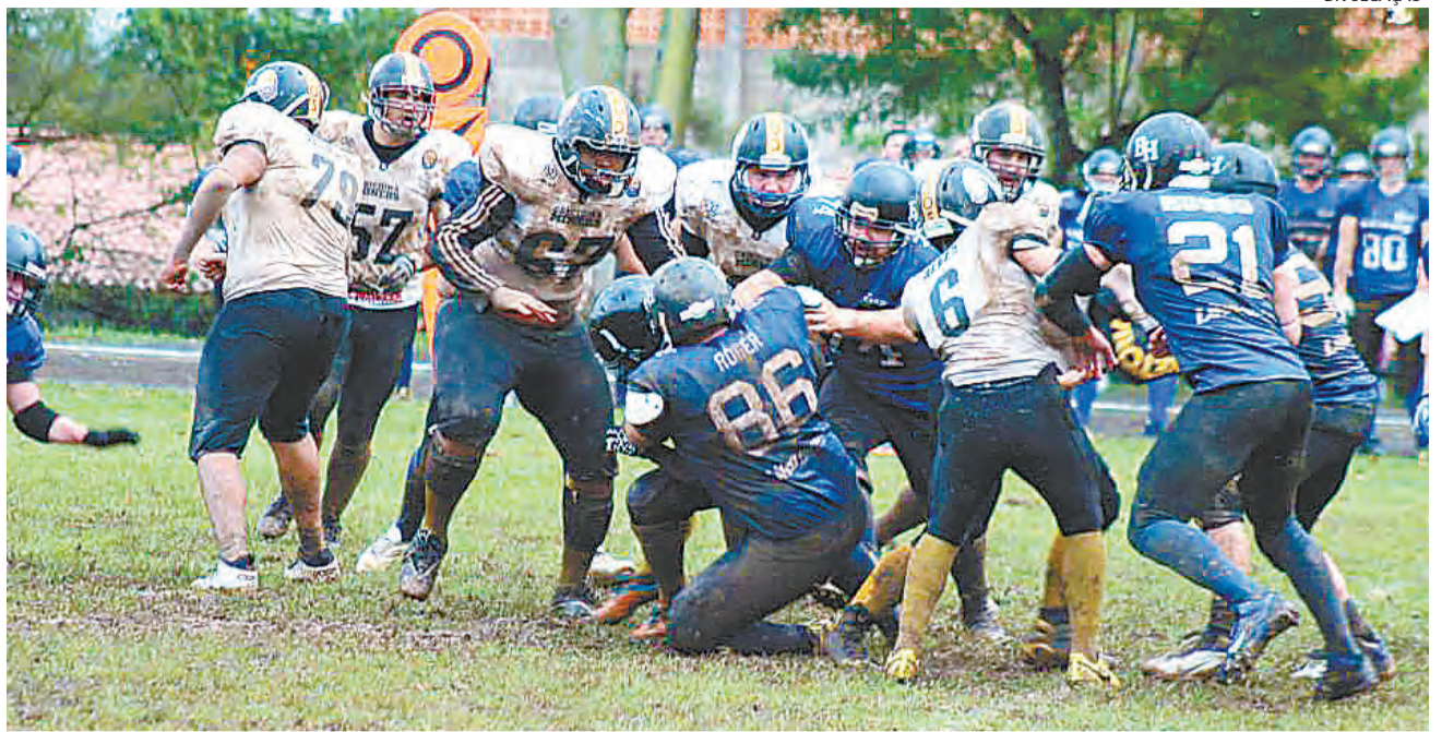
BLACK Haws é o representante de Gaspar no futebol americano

Além disso, Gaspar sediará o jogo entre o Black Hawks e o Tigers Football, de Curitiba, no dia 18 de setembro. As datas dos demais jogos dependem dos resultados.