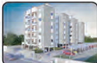
783 - 2 Dormitórios, Cozinha e sala integrados, Área de serviço, BWC, Sacada Com churrasqueira, elevador, 1 vaga de garagem. INC.: R/3-25.003 -Bairro Santa Terezinha. R$ 180.000,00