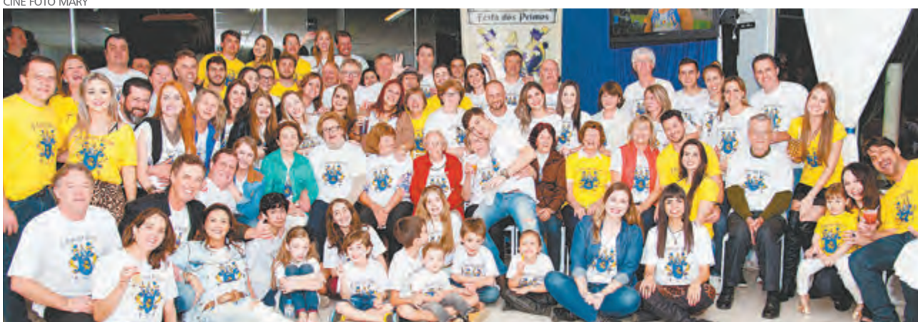
A família Muller se reuniu para mais um Encontro dos Primos Muller. A grande festa aconteceu no sábado, 6 de agosto, e teve registros de Cine Foto Mary.

Cooperação Técnica entre o Arquivo Histórico Documental Leopoldo Jorge T. Schmalz e Biblioteca Pública de Santa Catarina