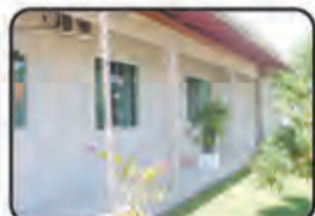
REF. 859 Casa 1 suite, 1 dormitório, 3 BWC, sala de visita, Tv e jantar, cozinha, área de serviço, despensa, garagem, piscina, portão eletrônico c/ 150 m 2 R$ 315.000,00