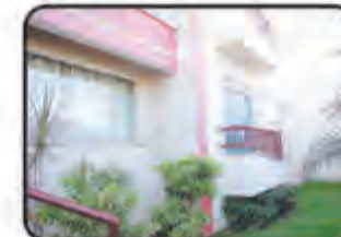
REF. 858 Apt. 2 dormitórios, BWC, sala de visita, sacada com churrasqueira, cozinha, área de serviço, portão eletrônico, garagem, elevador, C/ 80m 2 R$ 220.000,00