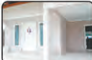
REF. 725 Casa 1 Suite, 2 Dormitórios, 1 BWC, Sala de Visita, Varanda, Cozinha, Área de Serviço, 2 Vaga na Garagem, Churrasqueira, Gás Central, Portão Eletrônico c/ 280m 2 R$ 480.000,00