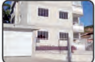
799 - Figueira - 1 Suite, 1 Dormitório, BWC, Sala de Visitas c/ 88 m 2 - R$ 204.000,00