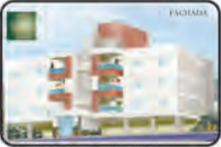
794 - Residencial Vila Serena- Apto no bairro Coloninha com 1 suite, 1 Dormitório, 2 vagas de Garagem, Elevador 75,51 M 2 INC.: 9-18272 - R$ 240.000,00