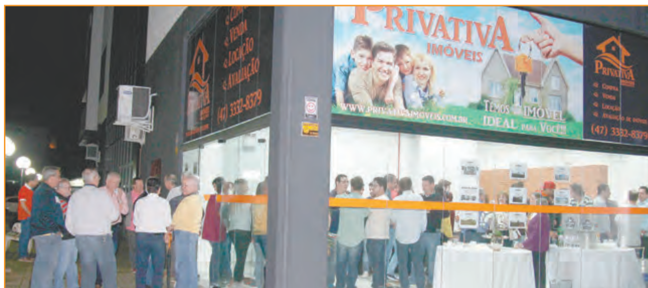
Coquetel de inauguração reuniu cerca de 100 pessoas na noite de quarta-feira, 17 de agosto

A Privativa Imóveis atende na rua Augusto Beduschi, número 87 - sala 2, mesmo prédio em que está localizada a Caixa Econômica Federal. O atendimento acontece de segunda a sexta-feira, das 8h ao meio dia e das 13h30 às 18h; e aos sábados, das 8h30 ao meio dia.