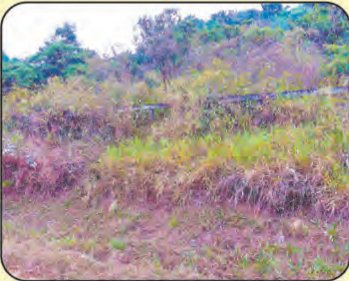
REF. 871 Terreno c/ 11.550 m 2 Santa Terezinha R$ 800 MIL