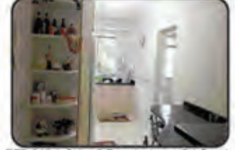
REF. 849 1 Suite, 2 Dormitórios, 1 BWC, sala de visitas e jantar, Sacada, 2 Vagas de garagem, Churrasqueira, Gás central, elevador c/ 127 m 2 07 de setembro R$ 530 MIL