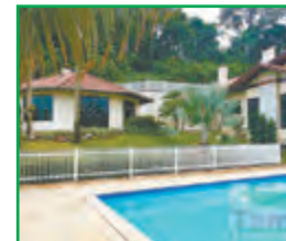
Ref. 1100 – Casa de Alvenaria no bairro Centro, terreno com 900m² e casa 380m², 01 dormitório, 02 suítes, 03 banheiros, 02 salas, cozinha, área de festas, piscina, 04 vagas de garagem. Valor: R$1.800.000,00