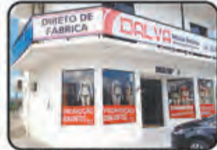
REF. 844 - Casa e Loja - 1 Suite, 2 Dormitórios, 3 BWC, sala de Visitas, Jantar e TV, Varanda, Copa, Cozinha, 3 pisos, sendo 1 o loja c/ 650 M 2 . Centro de Ilhota R$ 2.000.000,00