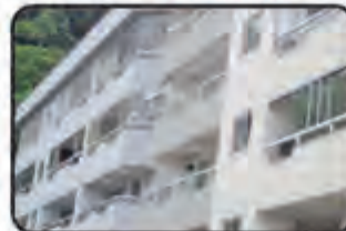
834 - Apto c/ 1 Suite, 1 Dormitório, BWC, Sacada, Cozinha, Área de serviço, 1 Vaga de garagem, Churrasqueira, Gás central, Elevadores, 80 m 2 . Rua Itajai - Bairro 07 de Setembro - R$ 250.000,00