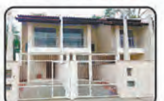
REF. 854 2 Dormitórios, 1 BWC, Lavabo, Sala de Visitas e TV, Cozinha, Garagem. Bairro Poço Grande. Sobrado Geminado C/ 93 m 2 . R$ 196.000,00