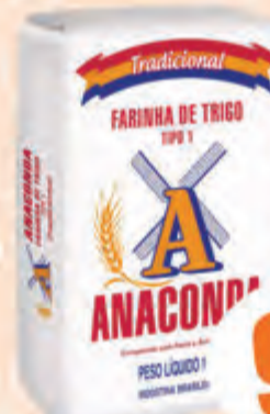
9,59 Farinha de Trigo Anaconda Trad. Pct. 5kg

*Ofertas válidas para o final de semana 25 a 26/03/2016, ou enquanto durarem os estoques. Válida somente para loja 8 em Gaspar