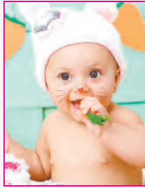
Luiza Pontes, 10 meses. Pais: Rafael e Cleide Pontes.