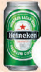
2,49 Cerveja Heineken Lta. 350ml