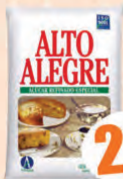
2,27 Açúcar Refinado Alto Alegre Pct. 1kg