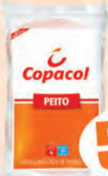
5,98 kg Peito Frango Copacol