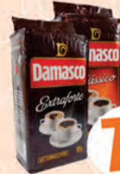
7,59 Café Damasco Pct. 500g