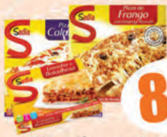
8,98 Pizza/Lasanha Sadia Cx. 460/650g (Empório)