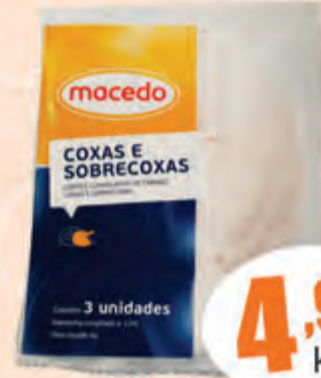
4,98 kg Coxa/Sobrecoxa Macedo