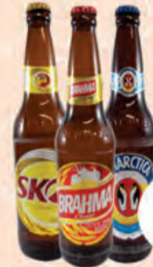
3,69 Cerveja Antartica/Brahma /Skol Trad. S/Casco Gfa. 600ml