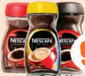
9,79 Café Nescafé Vid. 200g