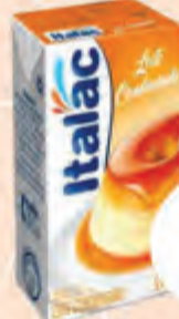
2,29 Leite Condensado Italac Pak. 395g