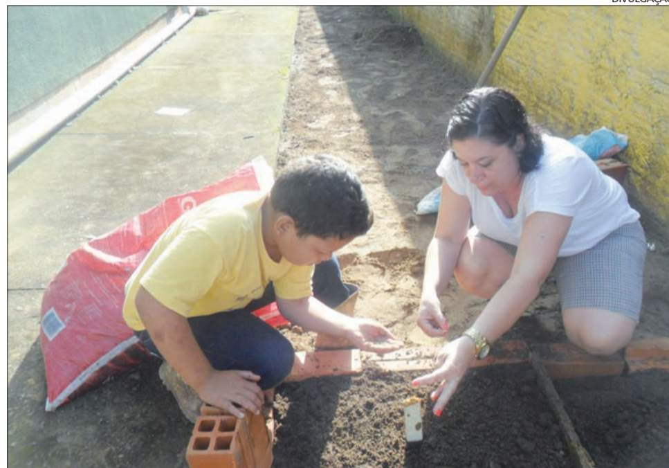
ESCOLA desenvolve atividades aos fins de semana ligadas a cultura, esporte e cidadania

A escola municipal Domingos José Machado, em Ilhota, está proporcionando à comunidade escolar espaços alternativos nos fins de semana para o desenvolvimento de atividades de cultura, esporte e formação para a cidadania, além de ações complementares de educação formal. O projeto, em vigor desde o dia 17 de maio, tem como objetivo impactar a vida das pessoas e auxiliar no cotidiano da escola. As atividades têm acontecido aos sábados. "Acreditamos que esta experiência contribuirá para a formação de um povo educado, conhecedor de seus direitos, com condições de se organizar como cidadão consciente. Essas ações irão ajudar na diminuição da violência e do bullying na escola e no bairro", afirma a diretora