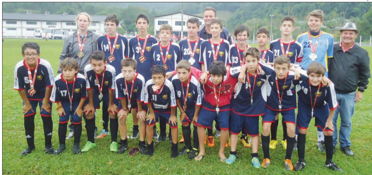
A equipe da Escola Norma Mônica Sabel sagrou-se campeã no gênero masculino na etapa municipal no ano de 2014

A etapa microrregional do Campeonato Catarinense Escolar de Futebol Moleque Bom de Bola, que aconteceria a partir dessa segunda, dia 25, até quarta-feira, 27, em Pomerode, foi adiada devido à chuva incessante que ocorre em Gaspar e demais cidades do Vale do Itajaí. As novas datas dos jogos ainda serão