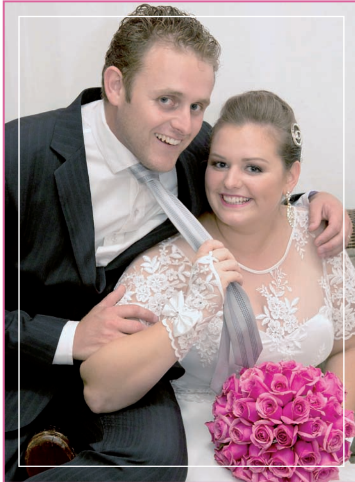
CINE FOTO MARY

colcci Julio Schramm SPECIAL STORE fashion 47 3332.0803