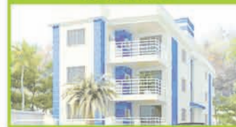
(OP 210) - Apto de nº 101 do Residencial Safira constituído de sala de estar/jantar, 2 dorm., sendo 1 suite, vvc, cozinha, a.s., sacada com churrasqueira e garagem. R$ 150 mil.