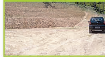
(OP 229) - Terreno industrial com toda a infraestrutura, pronto para construir, com área de 55.373,00m 2 , Rua Leonardo Pedro Schmitt, próx. Pesqueiro Santa Maria. R$ 400 mil.