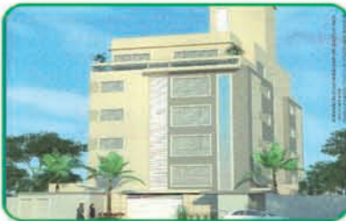
Ref: 768 Apartamento na planta com 2 quartos, 1 suíte, cozinha wc e garagem. Centro | R$ 347.922,04.