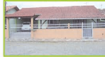
(OP 240) - Residência de alvenaria contendo sala de estar, 2 dormitórios, 2 Bwc, copa/cozinha, área de serviço, churrasqueira, garagem, murada. R$ 240.000,00.