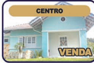
Ref. 414: Casa residencial ou comercial, com 180m2, 1 suíte, 2 dormi. 2 salas, copa, cozinha, bwc social com hidro, área de serviço, 2 vagas de garagem, escritório e Porão com acesso fácil. Terreno cm 419,10m2. Valor R$ 480 mil.