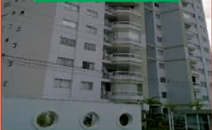
REF. 761 APTO COM 2 QUARTOS, WC, SALA, COZINHA, PISCINA E GARAGEM. VALOR: R$ 800,00 + CONDOMÍNIO