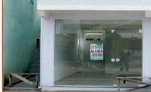
REF. 132 SALA COM 33 M2. VALOR: R$ 950,00.