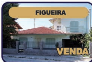
Ref. 746: Casa c/ 2 dorm., 2 bwc, sala, bar, coz., 2 despensas, área de serviço, garagem p/ 3 carros. 1º andar: 03 suítes. R$ Valor R$ 380 mil.