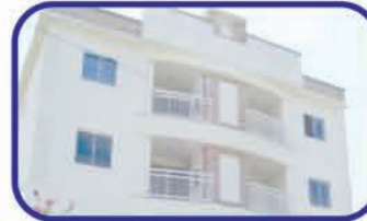
Santa Terezinha - Gaspar 1 suite, 1 dorm., bwc, sala, sacada c/ churrasqueira, copa, coz, área de serviço, garagem. De R$198.000,00 por R$185.000,00