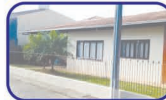
Margem Esquerda - Gaspar 1 suite, 4 dorm., 3 bwc, sala, escritório, coz., despensa, área de serviço, garagem e área de festas. De R$ 450.000,00 por R$ 429.000,00

Floricultura em pleno funcionamento com 70m 2 localizada na rua Barão do Rio Branco, bairro Santa Terezinha, em frente ao cemitério municipal.