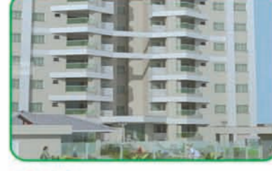
Ref: 756 Apartamento com 2 quartos, 1 suíte, sala, cozinha, banheiro e 2 vagas de garagem. Santa Terezinha | R$ 150.000,00.