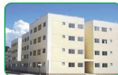
Ref: 772 Apto com 2 quartos, sala, cozinha, banheiro e garagem. Gasparinho | R$ 120.000,00.