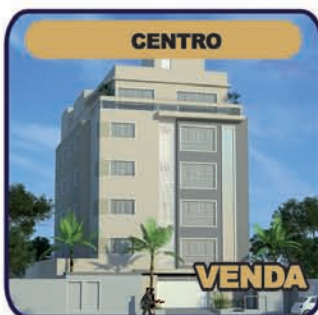
Ref. 752: Residencial Madri. R.6-1.113. A partir R$ 348 mil.