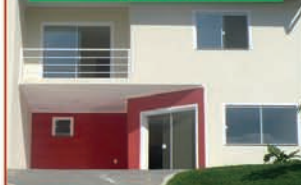
REF. 407 SOBRADO COM 3 QUARTOS, 2 BANHEIROS, SALA, COZINHA E GARAGEM VALOR: R$ 700,00.