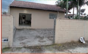
REF. 752 GALPÃO COM 100 M2, COZINHA E BANHEIRO. VALOR: R$ 1000,00.