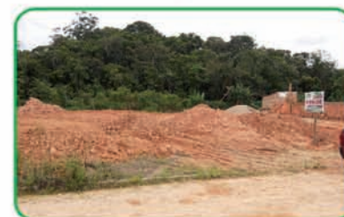
Ref: 741 Terreno com 364 m2. Santa Terezinha | R$ 110.000,00.