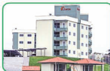
Ref: 734 Apartamento com 2 quartos, 1 suíte, sala, cozinha banheiro e 2 vagas de garagem. Santa Terezinha | R$ 235.000,00.

GASPARINHO SUBIDA/APIUNA MARGEM ESQUERDA SANTA TEREZINHA FIGUEIRA MARGEM ESQUERDA SANTA TEREZINHA STA. TEREZINHA MARGEM ESQUERDA SANTA TEREZINHA SANTA TEREZINHA SANTA TEREZINHA GASPAR MIRIM GASPAR MIRIM GASPAR MIRIM GASPARINHO MARGEM ESQUERDA MACUCO SANTA TEREZINHA SANTA TEREZINHA SANTA TEREZINHA GASPARINHO