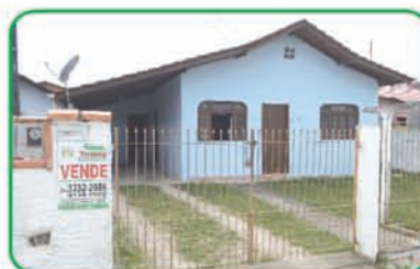
Ref: 736 Casa com 2 quartos, banheiro, sala, cozinha e garagem. Poço Grande | R$ 140.000,00.