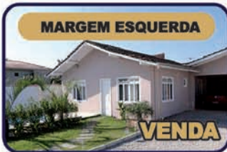
Ref. 727: Casa c/ 3 dorm., sendo 01 suíte, sala, copa/coz., bwc, lavabo, área de serviço, garagem p/ 2 carros, área de festas. Forro madeira/PVC. Piso cerâmico. Piscina. Portão Eletrônico. Valor R$ 260 mil.