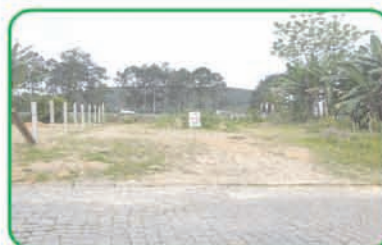
Ref: 739 Terreno com 300 m2. Margem Esquerda | R$ 133.000,00.