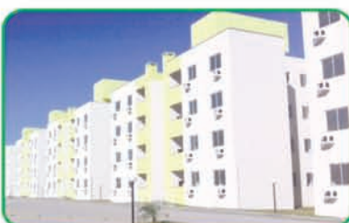
Ref: 755 Apartamento com 2 quartos, sala e cozinha. Sete de Setembro | R$ 159.000,00.

REF. 714 C/ 996M² PISO SUPERIOR C/ 498M² 8 CÔMODOS, 3 BWC; TÉRREO C/ 498M² R$2.500.000,00 CENTRO REF. 728 TERRENO COM 468M² E CASA COMERCIAL 183,37M², R$950.000,00 CENTRO