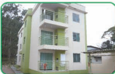
Ref: 771 Apartamento com 2 quartos, wc, sala, cozinha e garagem. Gasparinho | R$ 130.000,00.