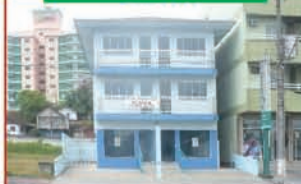
REF. 243 SALA COMERCIAL COM ÁREA DE 55 M2, 2 BANHEIRO. VALOR: R$ 750,00.