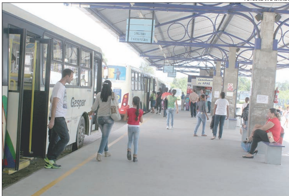
DISTÂNCIAS curtas e poucos horários à disposição estão entre as principais críticas