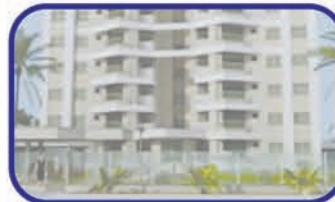
Margem Esquerda - Gaspar 1 suite, 2 dorm., bwc, sala, sacada c/churrasq, coz, área de serviço, 2 vagas na garagem, salão de festas. De R$ R$ 312.416,88 por R$ 281.175,20