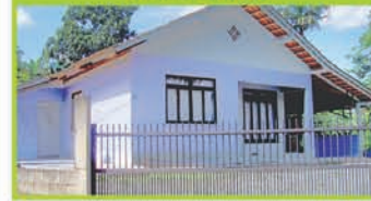
(OP 238) - Casa de alvenaria com sala de estar, 3 dorm., 2 wc, copa/cozinha, a.s., despensa, varanda e garagem, cercada. R$ 160 mil.(ACEITA FINANCIAMENTO).