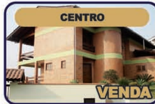
Ref. 730: Casa de alvenaria c/ 392,00m², 2 pisos c/ 4 dorm., sendo 01 suíte, bwc, sala de visita, sala TV, copa, coz., despensa, varandas, garagens, área de festas c/ bwc, sauna e piscina, lavanderia, adega - laje - aquecimento solar - horta - pomar e jardim. Valor R$ 950 mil.