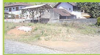
(OP 221) - Terreno 360,00m 2 , sendo 15,00m x 24,00m, lote nº 11-A localizado na Rua Curitiba, esquina com a Rua São Paulo, do Lot. São Francisco. R$ 160 mil.