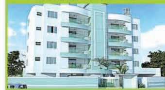
(F-01) Residencial Portinari, com 5 pavimentos, sendo o térreo garagens e mais 4 pavimentos de apartamentos, com 2 aptos por andar, elevador, acesso auto. O apto é constituído de sala de estar/jantar, 1 suite, 1 quarto, cozinha, área de serv., sacada c/ churrasqueira, 1 ou 2 vagas de garagem. Incorp. R-2-23.731. R$ 265 mil