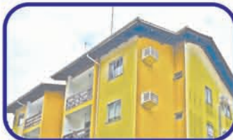
Sete de Setembro - Gaspar 1 suite, 2 dorm., bwc, sala, coz, área de serviço, 1 vaga na garagem, churrasqueira, salão de festas. De R$ 230.000,00 por R$ 218.000,00