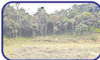
Gasparinho - Gaspar Ótimo terreno c/ 6000m 2 próximo ao Fazzenda Park Hotel. De R$ 130.000,00 por R$99.000,00