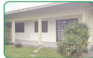
Ref: 742 Casa com 3 quartos, 2 banheiros, 2 salas, cozinha e garagem. Figueira | R$ 270.000,00.