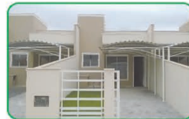
Ref: 764 Casa geminada com 2 quartos, wc, sala, cozinha e garagem. Santa Terezinha | R$ 155.000,00.