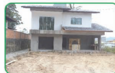
Ref: 719 Casa com 3 quartos, 1 wc, sala, cozinha e 2 vagas de garagem. Sete de Setembro | R$ 320.000,00.