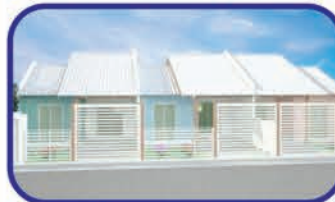
Santa Terezinha - Gaspar Geminado com 72m 2 , dois dormitórios, um banheiro, sala de jantar, sala de TV, cozinha, área de serviço, uma vaga de garagem, churrasqueira. R$ 165.000,00