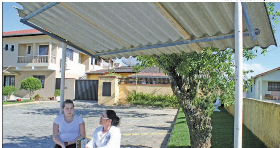
PRINCIPAL reivindicação dos usuários do transporte está relacionada à cobertura dos pontos

A indicação que faz parte da pauta da sessão desta terça-feira, 29, acompanha um anteprojeto de lei, cujo objetivo é “receber a colaboração, feita diretamente, por pessoas físicas ou empresas