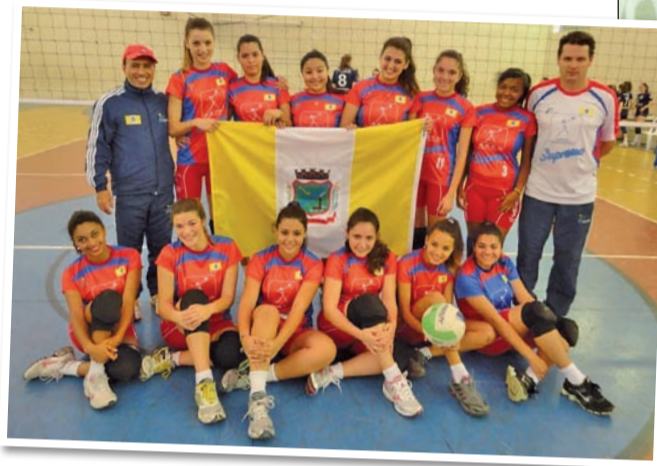
Fase Regional da Olesc, em Guaramirim

Santa Catarina), e em 2012 conquistou, junto com a equipe da escola, o terceiro lugar na etapa estadual da competição, neste mesmo ano jogou a Olesc fase regional por Gaspar.