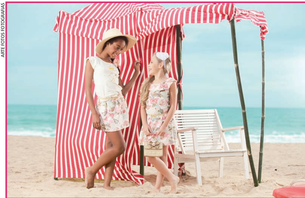
ARTE FOTOS FOTOGRAFIAS

A Praia Brava, em Itajaí, foi o local escolhido para as fotos do catálogo de verão 2014 da Fiotty Kids.