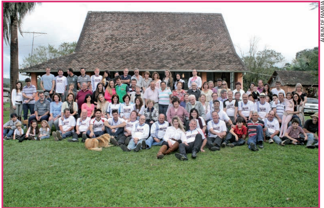
ALBUM DE FAMILIA