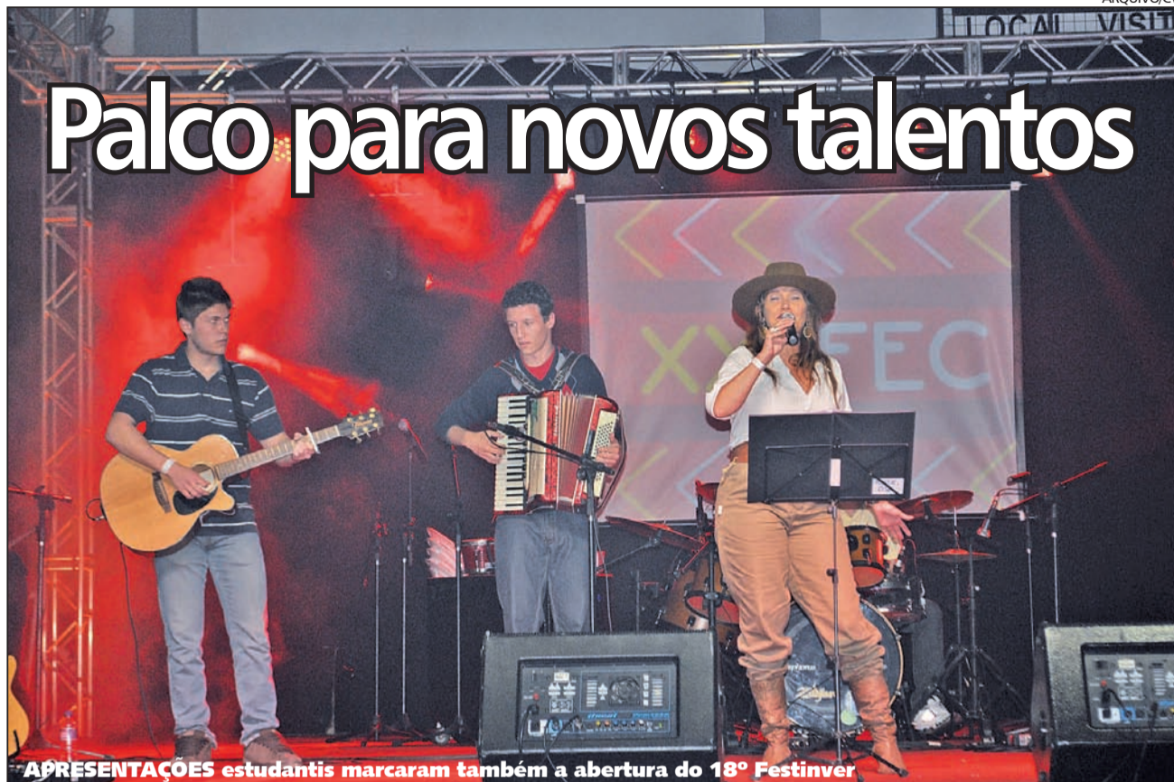
APRESENTAÇÕES estudantis marcaram também a abertura do 18º Festinver

Uma noite cheia de talentos, surpresas e muita emoção. Assim pode ser definida a noite desta quinta-feira, 4, quando teve início o 22º Festival Escolar da Canção, FEC, que marcou também a abertura oficial da 18ª edição do Festival de Inverno de Gaspar, Festinver. Mais de 30 cantores subiram ao palco do Ginásio João dos Santos nesta primeira noite de festival para se apresentar. Nesta sexta-feira, 5, o evento continua e promete trazer novamente belas atrações.