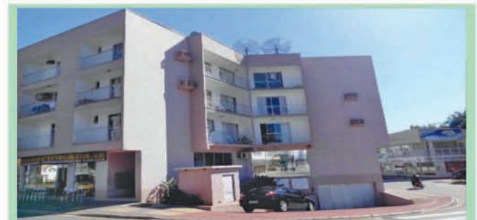
Ref 553 Apartamento com 129,53m², 3 dormitórios, 1 sala, 1sala de jantar, 1 cozinha, 1 banheiro, 3sacada, 1 garagem, área de serviço, portão eletrônico e interfone. Bairro: Centro. R$220.000,00