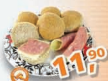
Archer Pão Integral Bolinha Kg