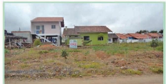
Ref 554 Terreno com 360m². Bairro: Poço Grande. R$95.000,00