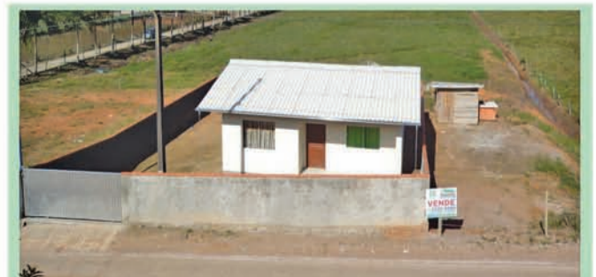
Ref 550 Casa de Alvenaria com 68m², 2quartos, 1 sala, 1cozinha, 1banheiro, 1 garagem, área de serviço, murada. Com terreno de 11.721,00m². Bairro: Macucos.R$290.000,00