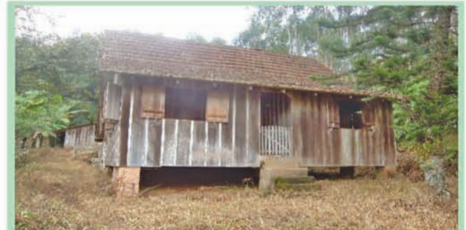
Ref 544 Sítio com rancho, com 511.426,00m².Bairro: Arraial do Ouro. R$450.000,00

Ref.498 Com Casa 80m². Terreno 41.000m². R$220.000,00. Gasparinho Ref.513 Com Rancho 96m² Terreno 7.068,75m² R$ 95.000,00 Gasparinho Ref 534 com Casa .Terreno 46.000m².R$350.000,00. Gasparinho.