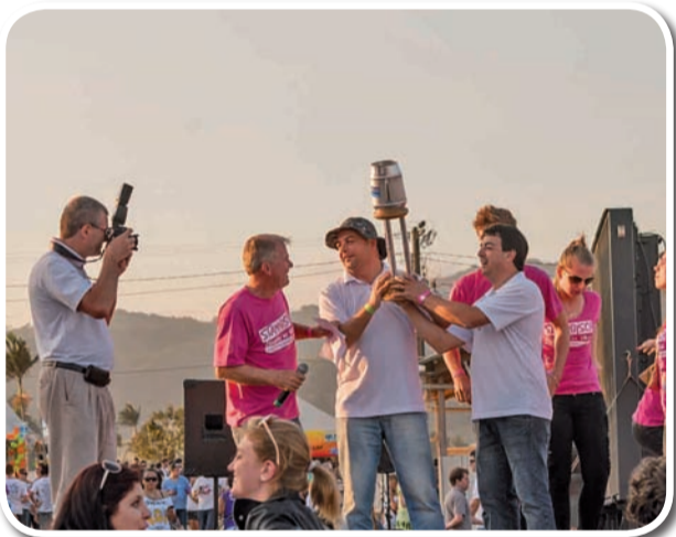
Barraca mais limpa - Núcleo Imobiliário de Gaspar