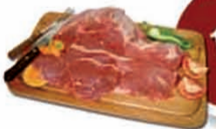
ALCATRA S/ OSSO BOVINA