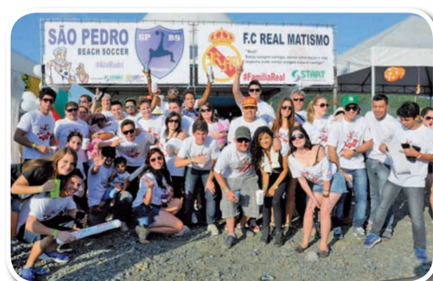
F. C. Real Matismo - São Pedro Beach Soccer