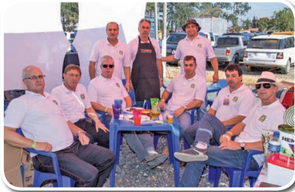
Núcleo Setorial Imobiliário