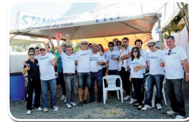
Amigos do Titi