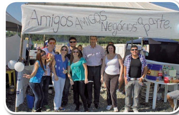
Amigos amigos, negócios à parte