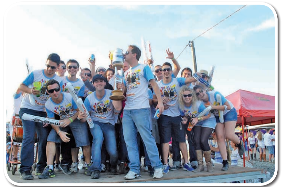
Melhor decoração - Freicumadre

acesse www.CRUZEIRODOVALE.com.br para mais fotos