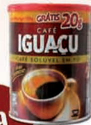
CAFÉ SOLÚVEL IGUAÇU 200G