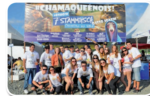
Chama que é nós