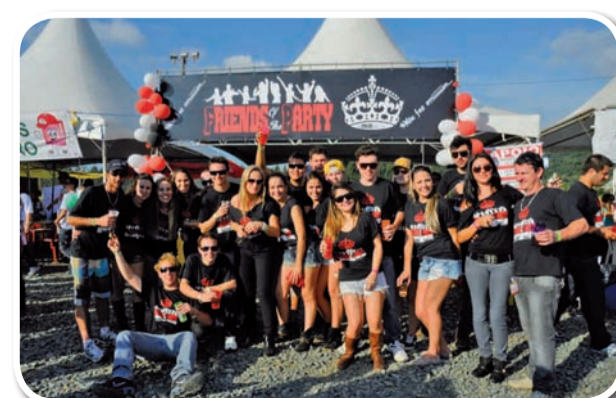
Friends Of The Party