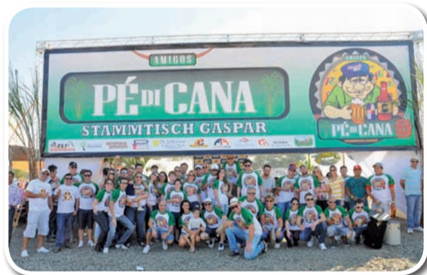
Amigos Pé de Cana