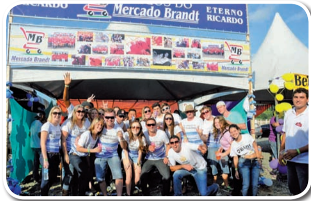
Amigos do Mercado Brandt