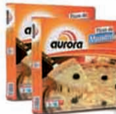
PIZZA AURORA 600G