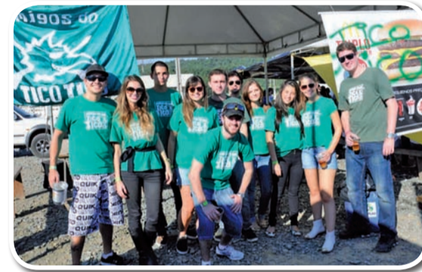
Amigos do Tico Tico