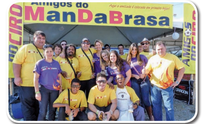
Amigos do Mandabrasa