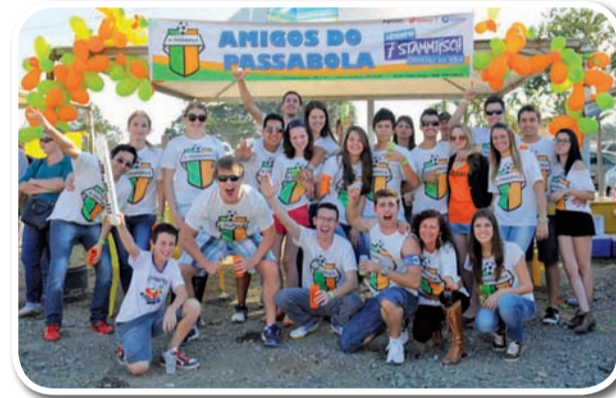
Amigos do Passabola