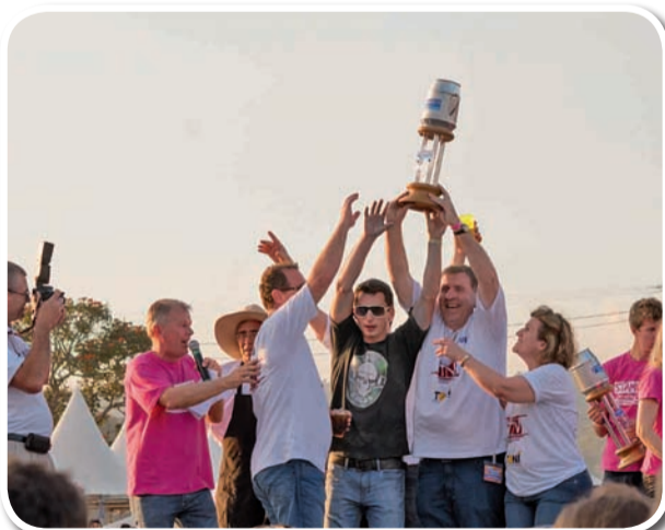
Melhor culinária - Churrascaria Toni e TV Gaspar