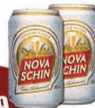
CERVEJA NOVA SCHIN 350 ML