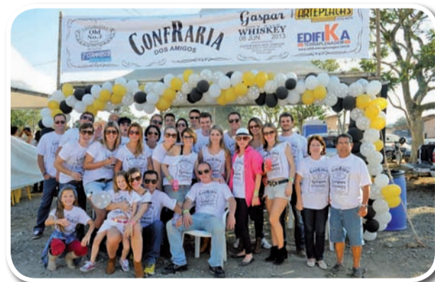
Confraria dos Amigos