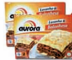
LASANHA AURORA 460G