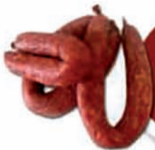
LINGUIÇA MISTA DEFUMADA BELCHIOR