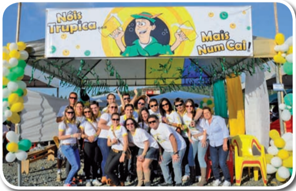
Nóis Trupica Mais Num Cai