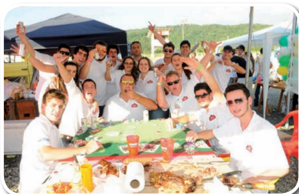
Turma da Stella