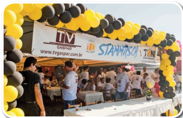
Churrascaria Toni e TV Gaspar