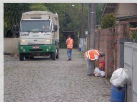
Coleta de lixo orgânico