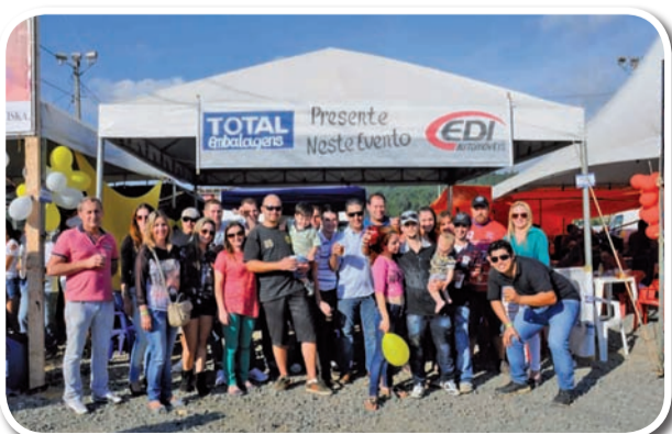
Total Embalagens e Edi Automóveis