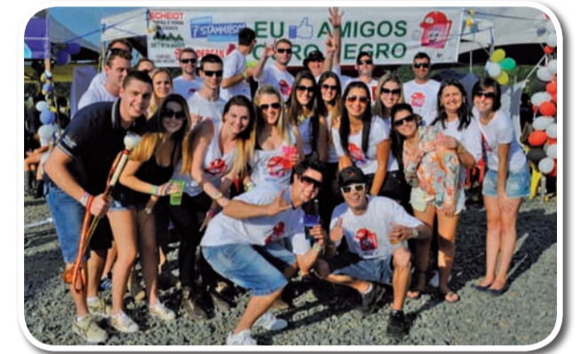
Amigos Ouro Negro