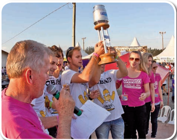
Melhor Batuque - Amigos do OBA!!!