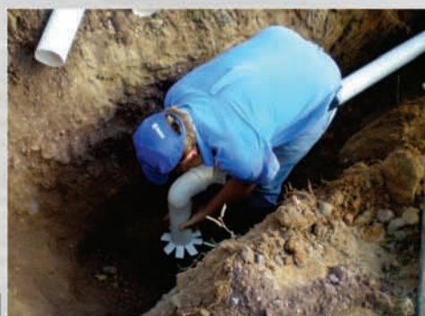
Ligação predial de esgoto