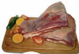
COSTELA BOVINA PONTA CONGELADA