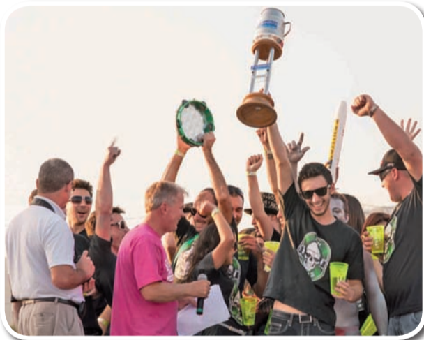
Grupo mais animado - Elite Nagas