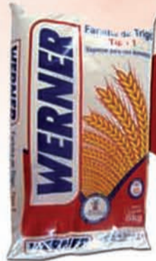
FARINHA DE TRIGO WERNER 5KG