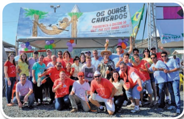
Os Quase Cansados