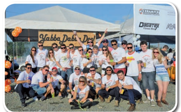
Yabba Dabba Doo