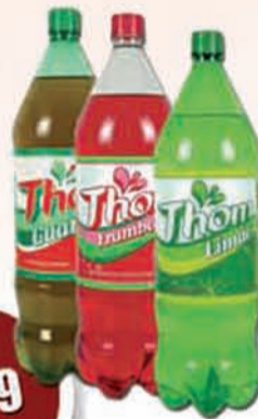
REFRIGERANTE THOM 2L