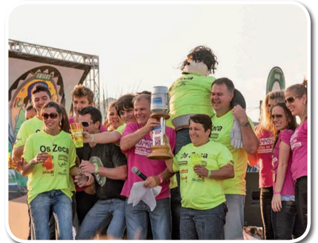
Mascote mais criativo - Os Zeca