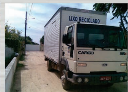
Coleta de lixo reciclável

Cuidar do meio ambiente é uma questão de atitude! 5 de Junho - Dia mundial do Meio Ambiente!