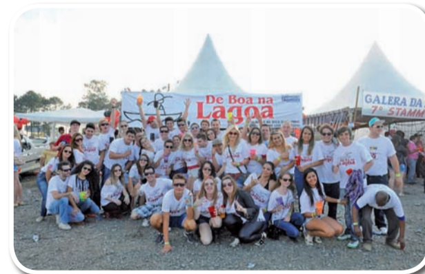
De boa na lagoa