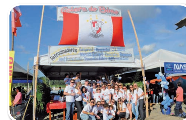
Galera do Bimo