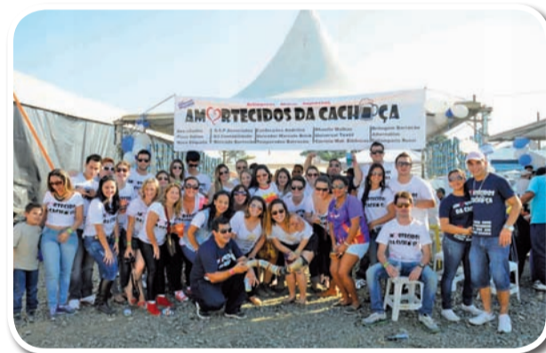
Amortecidos da Cachaça