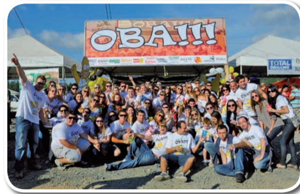
Amigos do OBA!!!