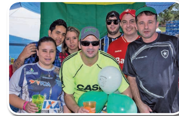
Amigos do Futebol