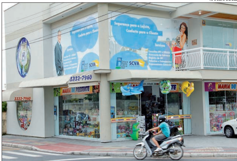
AULAS ocorrem a partir de abril na nova sede da Câmara de Dirigentes Lojistas, CDL

As empresas que se interessarem em participar do programa, oferecendo vagas aos jovens aprendizes, deverão entrar em contato com o Senac de Blumenau ou com a Câmara de Dirigentes Lojistas de Gaspar, CDL, até 13 de março. Entre 13 e 23 de março, as empresas deverão selecionar os futuros participantes do programa.