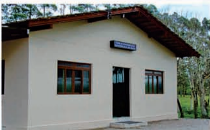
Rua: Henrique Thon, sn - Bairro: Poço Grande Dias de Culto: Terça - 19h 30min / Quinta - 19 horas Sábado - 19 horas / Domingo - 18 horas