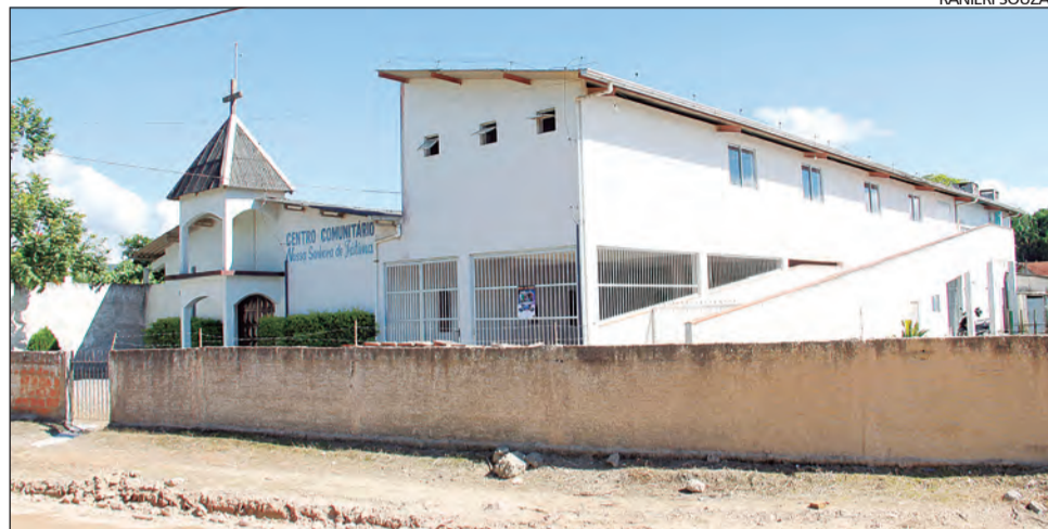
IGREJA espera receber centenas de fiéis para sua tradicional festa neste sábado e domingo