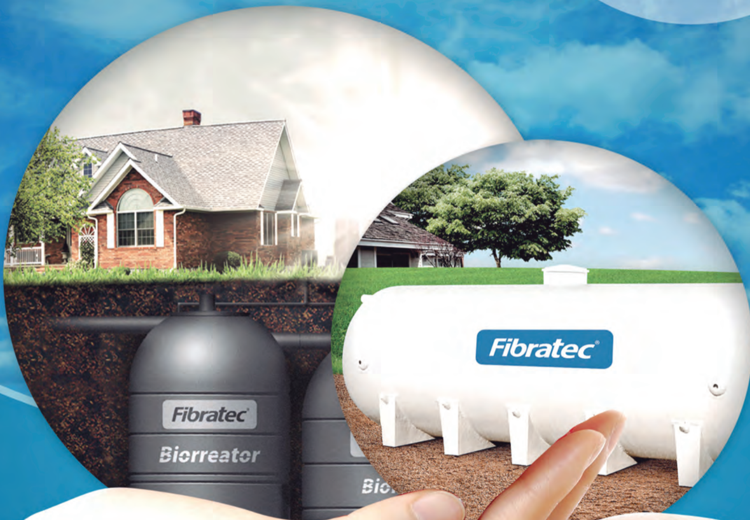
IMAGEM: AÇÃO 47 3264.9812